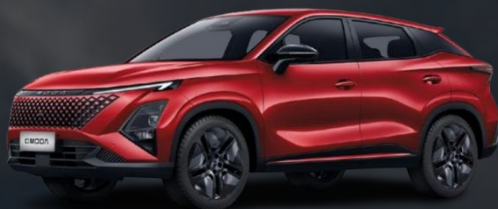
PASSION RDEČA (brezplačna)