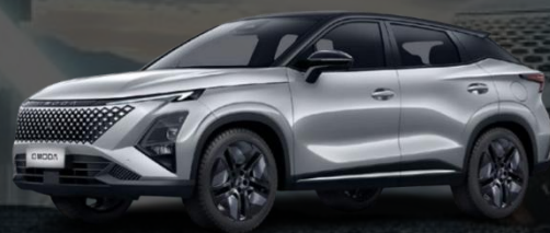
AVIATION SREBRNA + ČRNA STREHA* (800.00 €)