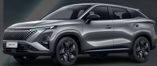
PHANTOM SIVA (500.00 €)