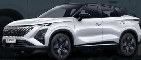
PEARL BELA + ČRNA STREHA* (800.00 €)

*Črna streha je dostopna zgolj na verziji Prime