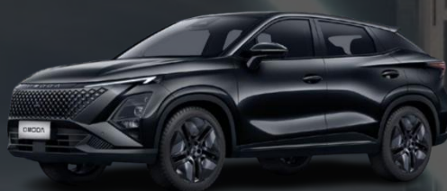
CARBON CRYSTAL ČRNA (500.00 €)